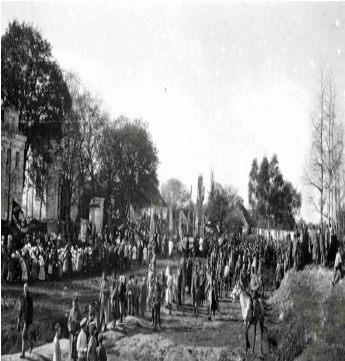
Фото Процесія з нагоди прибуття до Луцька очільника Польщі Юзефа Пілсудського, 1922 р.