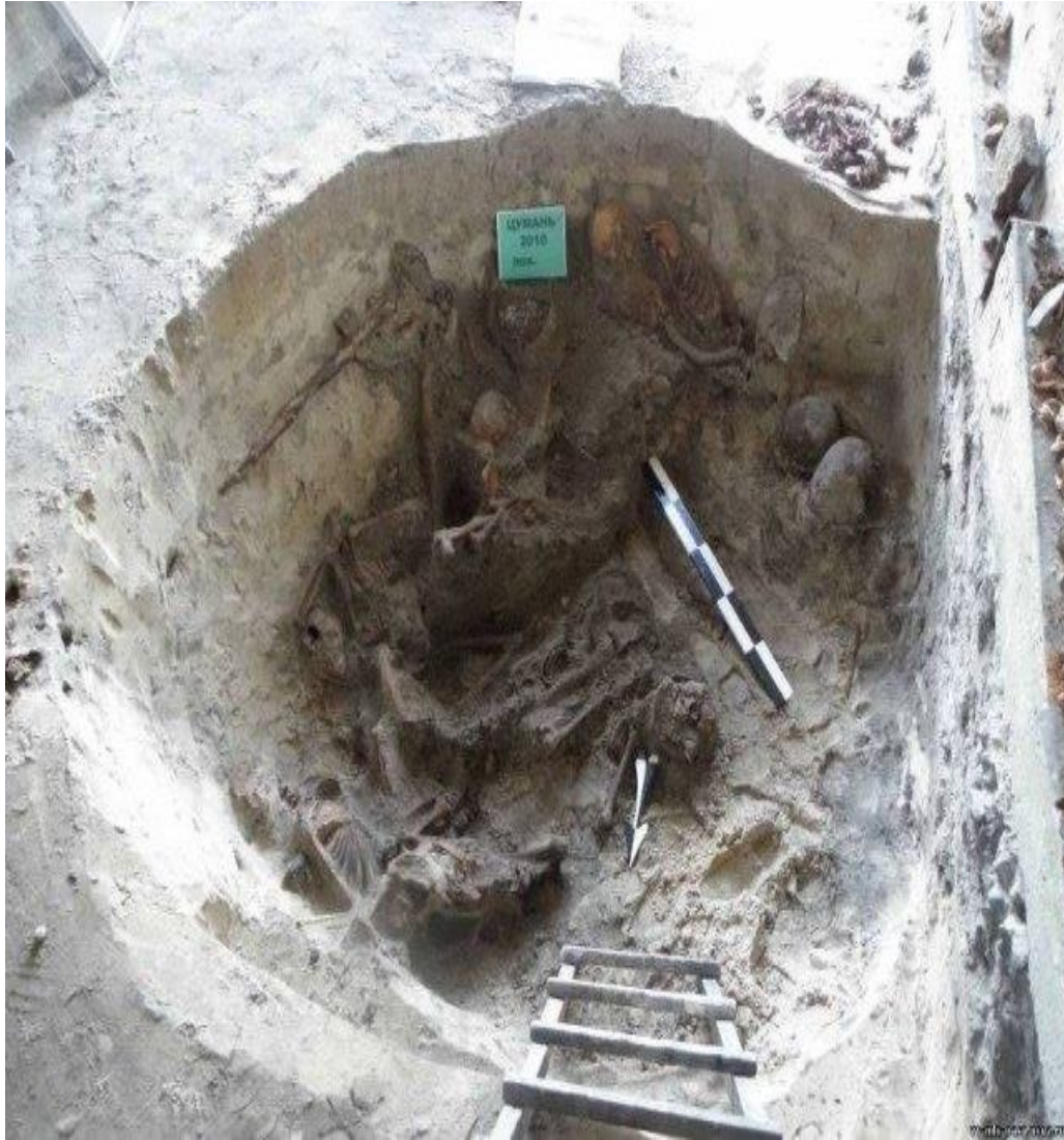
Фото місця розкопу поховання червоноармійців в Цумані.